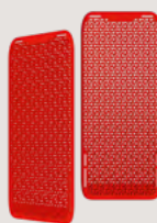
Protector Air Back

Level: Level 1 und Level 2 2704-0751 und 2704-0752