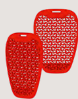
Protector Air Hip

Level: Level 1 und Level 2 2702-0317 und 2702-0318