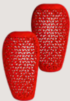
Protector Air Knee

Fast alle Modelle unserer Kollektion lassen sich durch den Einsatz von superkomfortablen Protektoren verstärken. Wer aufrüsten möchte, kann Hosen, Hemden und Jacken ganz einfach mit unseren Knie-, Hüft- und Rückenprotektoren ausstatten und ist damit im Falle eines Aufpralls noch besser geschützt.