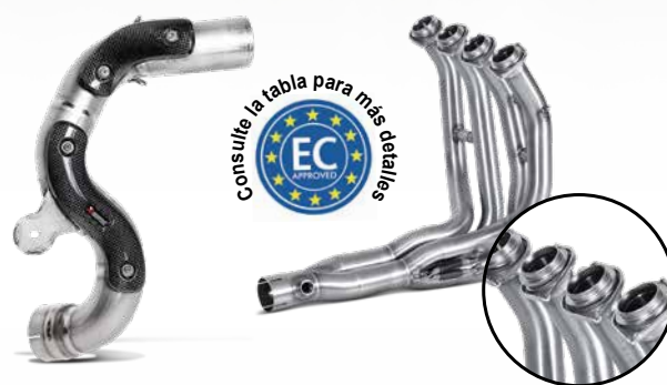
1 Tubo de unión Track Day